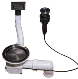
Piletta automatica Space Push Gun Metal - PO 8407 120