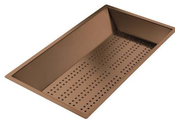
Vaschetta forata inox PVD Copper 8151 008