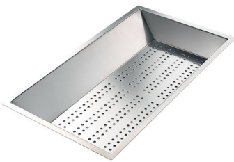
Vaschetta forata inox 8151 000 * solo in abbinamento con l'accessorio 8644 101