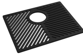
Griglia Black 8100 652